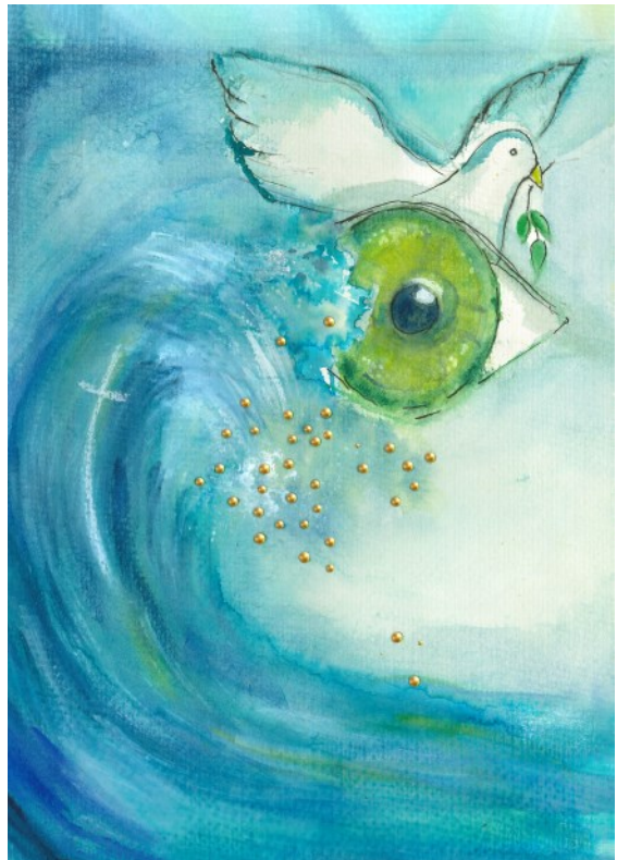
Aquarelle von Tina Bühring

Prüft alles und behaltet das Gute! 1. Thessalonicher 5,21 Das ist dann die Jahreslosung. Ob uns das gemeinsam gelingt? Ich grüße Sie herzlich auch aus den Kirchengemeinderäten Kölzow und Bad Sülze Pastorin Susanne Attula